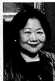
樋口恵子(ひぐち けいこ)